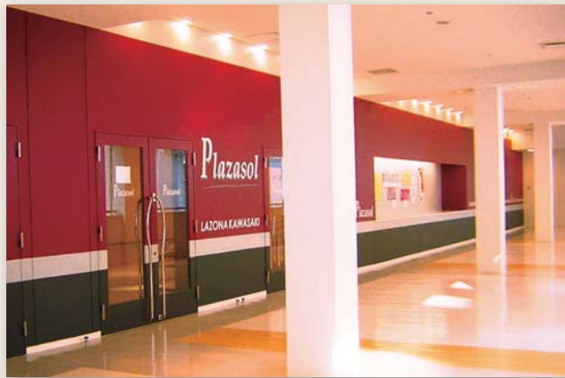
ラゾーナ川崎プラザ5F・プラザソル入口

プラザソルの 利用料金 と 予約受付開始の時期 は 利用日数 と 入場料の値段 で決まります。 詳しくはホールへおたずねください。